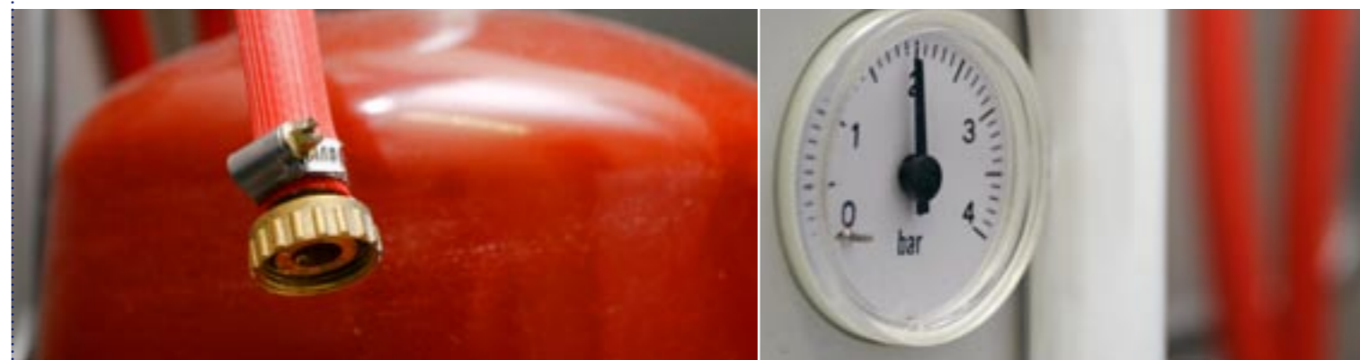
VULSLANG EN DRUKMETER